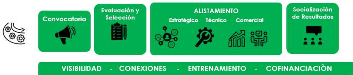
Ilustración 3: Programa Alistamiento Bioproductos Innovadores Bogotá Región