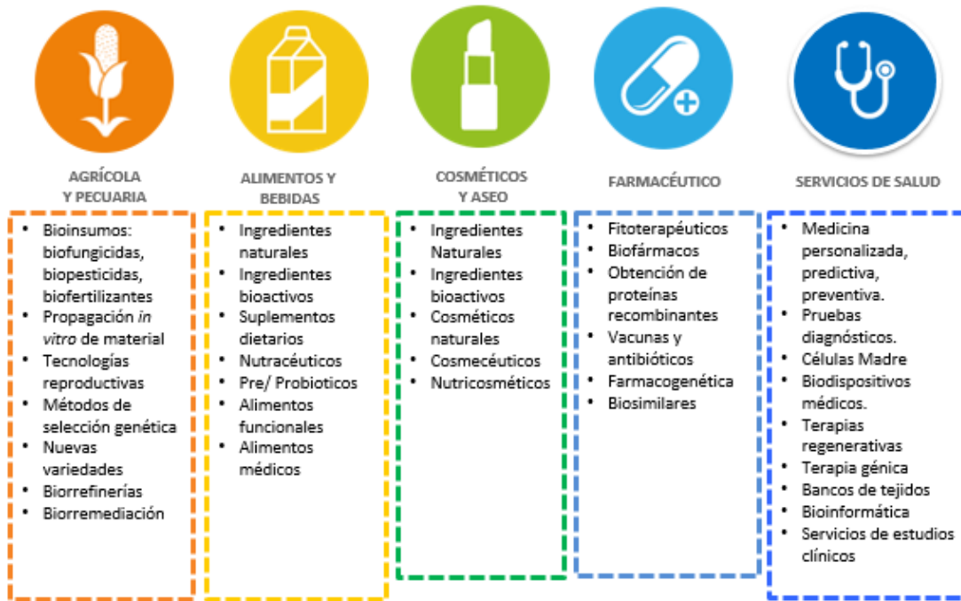
Ilustración 2: Aplicaciones de biotecnología por sector de interés